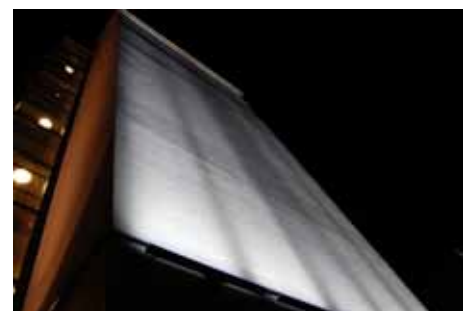
Valot luovat taloon viihtyisyyttä.